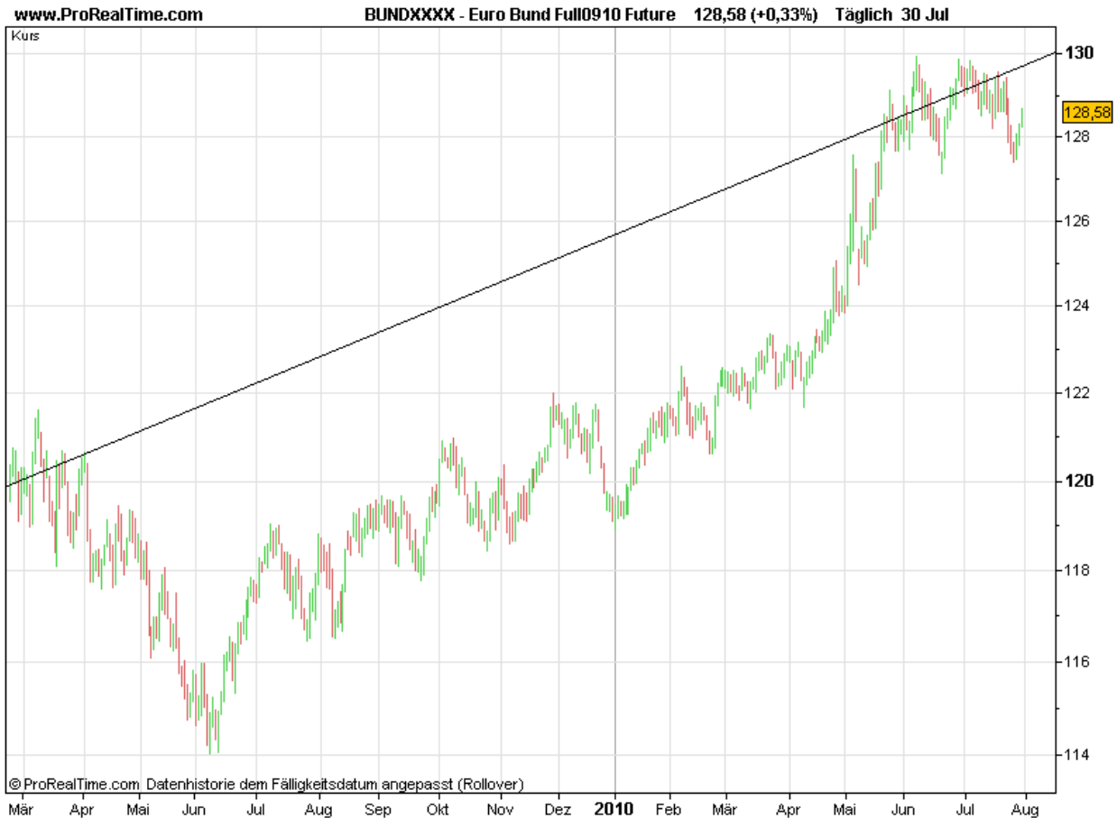
Abbildung 6: Kursverlauf des Futures der 10-jährigen deutschen Staatsanleihen

In Europa sind wir zwar noch nicht soweit. Hier überwiegt noch der Schein positiver Verlautbarungen aus Unternehmen, Verbänden und Politik. Trotzdem konnte der Bund-Future sich deutlich von den Tiefständen erholen.