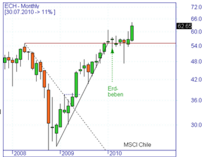
Abbildung 2: Kursentwicklung des MSCI Chile

Die chilenischen Banken konnten ihren Ertrag im ersten Halbjahr 2010 auf 1.55 Mrd. $ steigern, das sind 57 % mehr, als 2009.