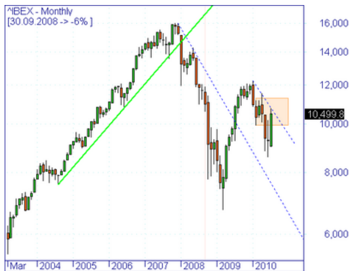
Abbildung 1: Monatschart des spanischen IBEX

Die großen, international tätigen Unternehmen "retten" das Land vermutlich vor einem Kollaps. Tatsächlich sind gerade die Index-Schwergewichte, Telefonica , Endesa , Banco Santander , sehr erfolgreich in Europa und Südamerika tätig. Deshalb darf man die zweistelligen Kurszuwächse im Juli nicht als Maßstab für die Gesundung der spanischen Ökonomie sehen. Vielmehr ist die Kursentwicklung ein Proxy für die Attraktivität lateinamerikanischer Beteiligungen der Indexschwergewichte.