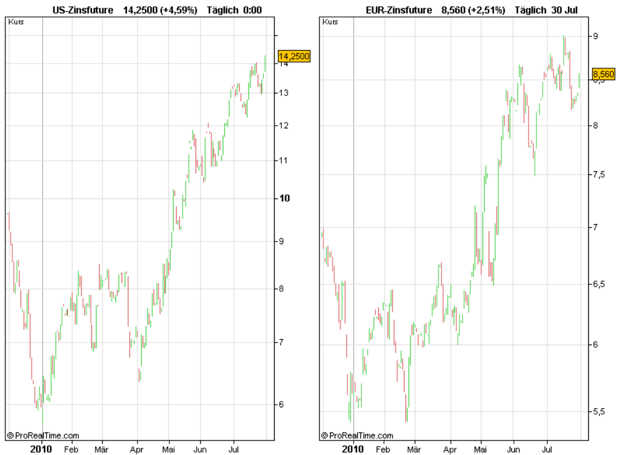
Abbildung 7: Kursverlauf des Spreads: Kauf einer 10-jährigen US-Staatsanleihe und Verkauf eine Staatsanleihe mit zweijähriger Laufzeit (links) und gleiches für deutsche Staatsanleihen (rechts)