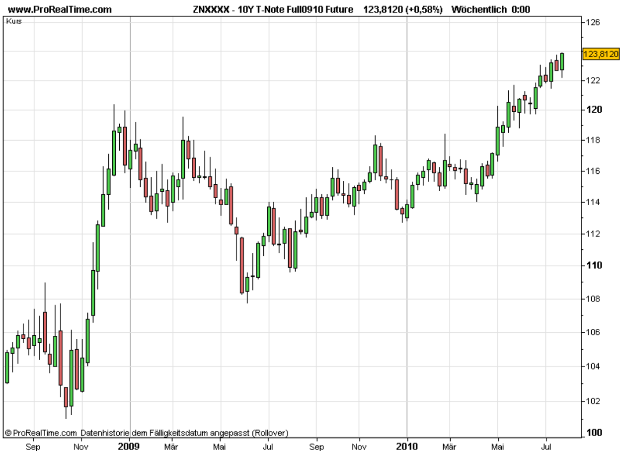
Abbildung 5: Kursverlauf des Futures der 10-jährigen US-Staatsanleihen

Die Aktienmärkte hat das freilich nicht tangiert: Getrieben von teilweise hervorragenden Quartalsmeldungen berichtender Unternehmen wurden Abwärtsimpulse stets wieder dynamisch korrigiert.